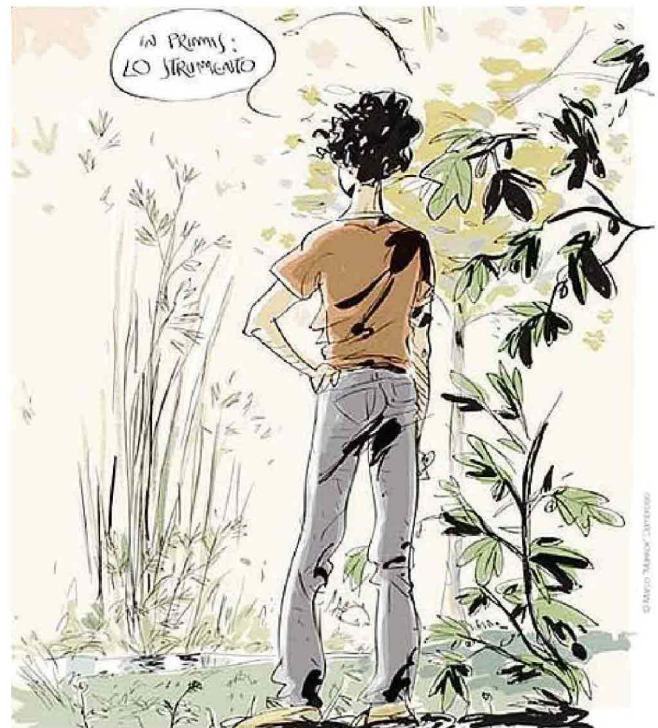
Un disegno da "Ladolescenza" di Makkox

Cambiamo decisamente genere con "Indignados! Suggerimenti per una ri(e)voluzione" (001 Edizioni, pp.