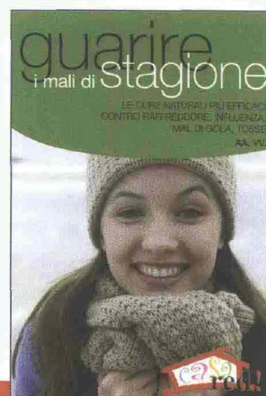
AA.VV. Guarire i mali di stagione Edizioni Red, 112 pagg., 5,90 euro

L' inverno non è ancora terminato ed i virus influenzali sono più aggressivi che mai. Niente di meglio che avere sotto mano questo "pronto soccorso" da sfogliare, ricco di consigli e ricette per affrontare le piccole patologie scatenate dal freddo, dal catarro alla febbre. Oltre ai suggerimenti dietetici (l'influenza si combatte prima di tutto eliminando i cibi "intossicanti" come salumi, formaggi grassi e dolci), bisogna poi saper utilizzare le erbe giuste. Contro la secchezza della gola e la tosse nervosa è per esempio un toccasana la tisana di liquirizia: basta un cucchiaino di radice tenuto in infusione per 10 minuti in una tazza d'acqua.