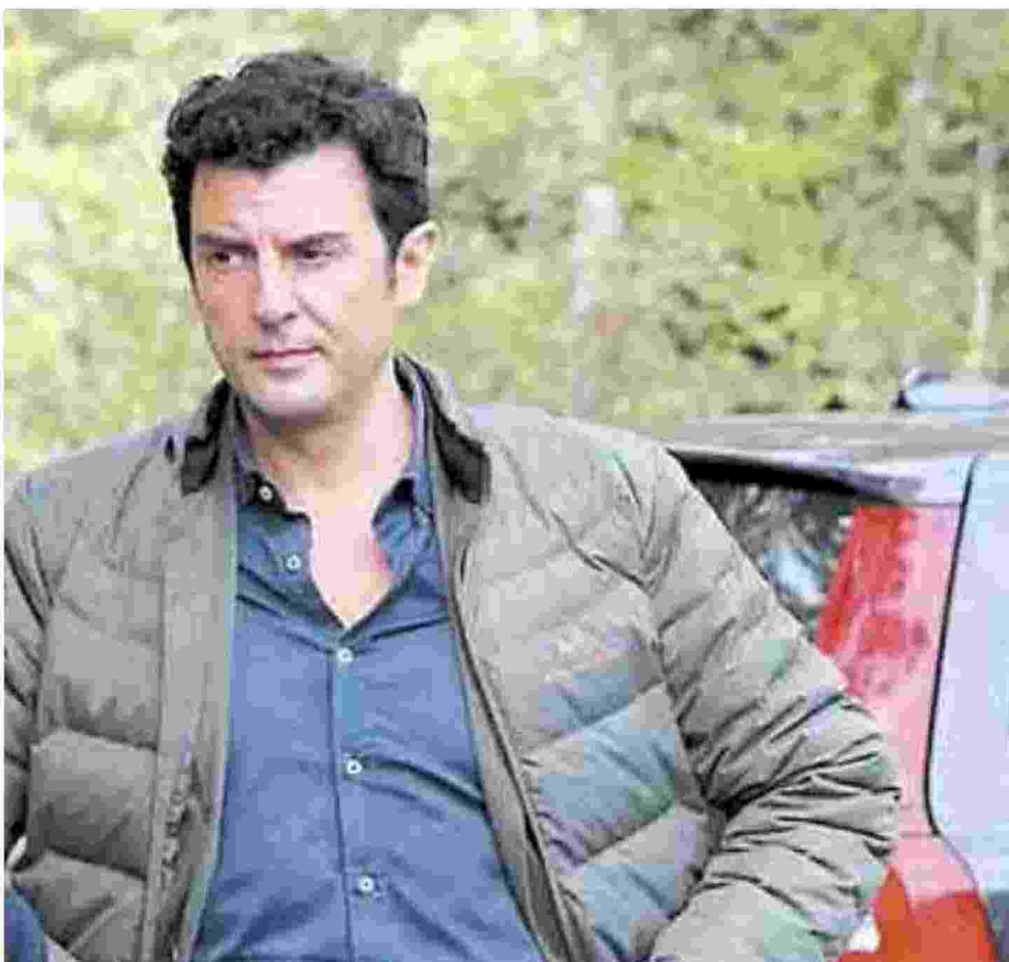
Autori Ianniello e in alto Piccolo: tra i più letti in libreria