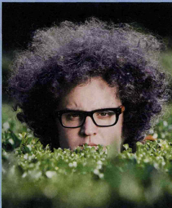
Simone Cristicchi arriva alla Feltrinelli con un libro e un cd