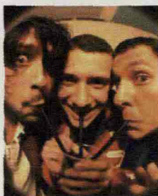
La band milanese

Urlano meno e hanno testi più riflessivi, ma i Ministri sono una delle realtà rock più interessanti e anticonformiste. A ottobre il trio milanese ha pubblicato Fuori che presenta giovedì 25 novembre ore 22 al Magnolia (via Circonvallazione Idroscalo 41, Segrate,