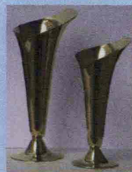
Calle di Tiffany