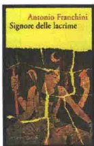
Signore delle lacrime di Antonio Franchini (Marsilio)

parte le persone che fotografano ossessivamente, a raffica, come cacciatori che sparano su tutto ciò che si muove, difficilmente sono simpatiche». Quest'altra ancora: «Essendo la maggior parte delle fissazioni dell'umanità fonte di rotture più per chi gli sta attorno che per chi ne è affetto». E, infine, una intuizione preziosa: «Forse gli uomini, più che i loro pregi e difetti, sono le loro ossessioni».