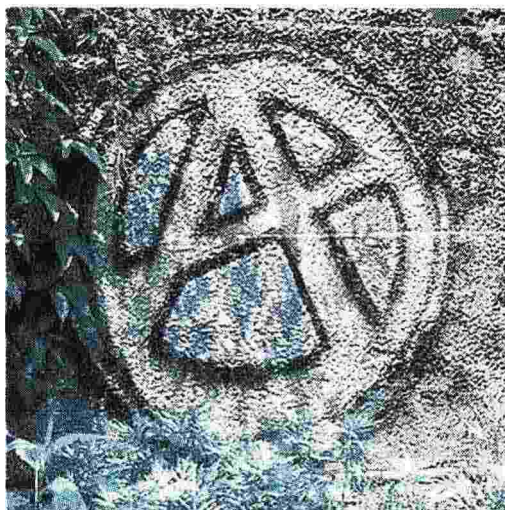
Simbolo anarchico su un muro di Roma

● Il saggio di Antonio Senta Utopia e azione . Per una storia dell'anarchismo in Italia è edito da Elèuthera (pp. 255, € 15)