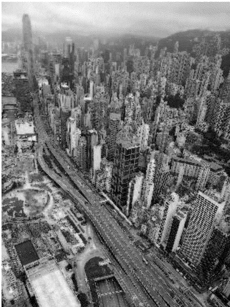
Una veduta aerea dello Skyline di Hong Kong

legittimo dire che non possiamo non dirci, in qualche modo, anarchici. Oltre ogni significato ed esperienza storica dell'anarchia, e oggi e proprio oggi. D'altra parte, alla domanda, «Ma in definitiva che cosa è l'anarchia per te?», il saggio e gentile, il pacato e umile Colin Ward, in un incontro con un gruppo di giovani romani organizzato con quattro amici architetti (sic) e operatori sociali e volontari, rispose con la più bella definizione attuale di anarchia che io abbia mai sentito: «È una forma di disperazione creativa». ❖